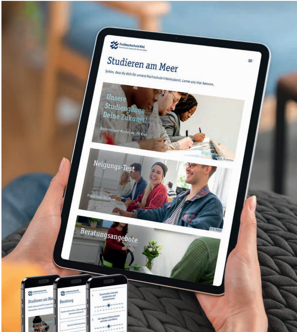
Die Progressive Web App der Hochschule bündelt wichtige Informationen.